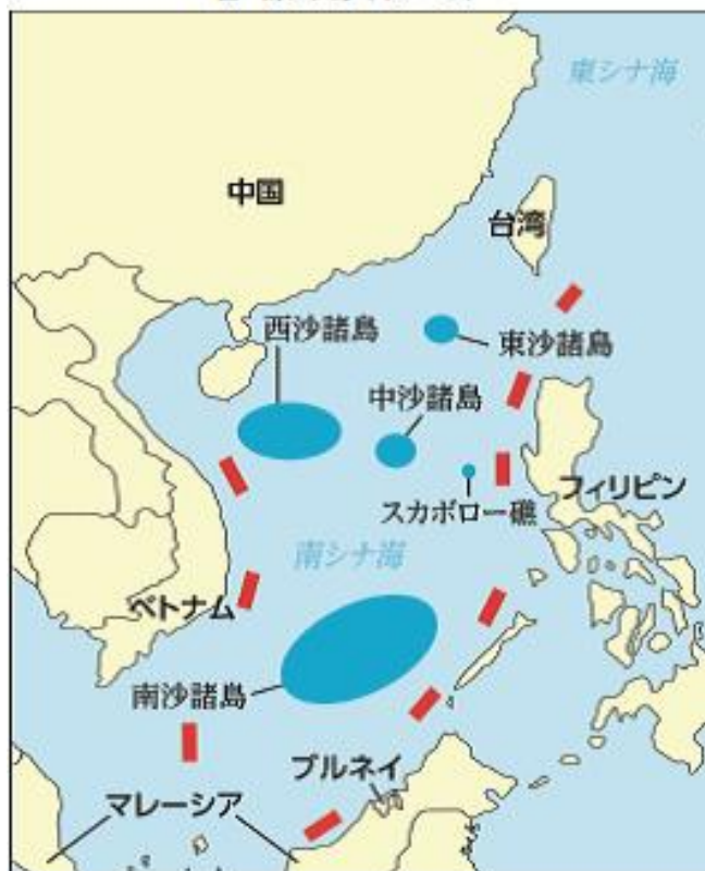
図 南シナ海（イメージ）