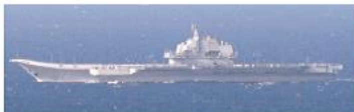
太平洋に進出する中国空母「遼寧」(16 (平成 28) 年 12 月 25 日)

これに対して、日米は巻き返しを図りつつあるも、十分に奏功しているとは云い難い。本稿ではそれらの状況を概観したい。