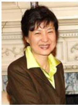
（朴槿恵韓国次期大統領）

更に、米国の強い意向もあったのだろうが、日米韓3国による防衛・外務当局者による安全保障協議を定例化する方針を決たとも報ぜられた。（1月10日）