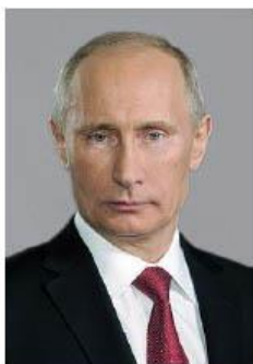
(プーチンロシア大統領：ウィキペディアから)

安倍首相は、就任早々にロシアのプーチン大統領と電話会談し、日露首脳会談の早期開催を呼び掛け、自身の訪露について調整を行うこととしたと報ぜられている x。首相訪露に先立ち、森元総理を特使として派遣する予定であり、関係改善の萌芽を感じさせる。