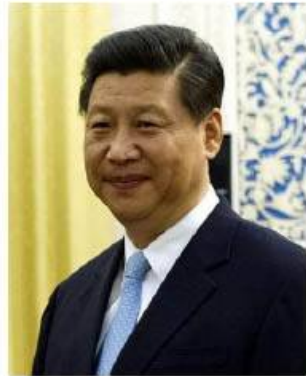
(習近平中国総書記：ウィキペディアから)