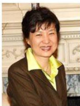
(朴槿恵韓国次期大統領：ウィキペディアから)

更に、米国の強い意向もあったのだろうが、日米韓3国による防衛・外務当局者による安全保障協議を定例化する方針を決たとも報ぜられた。(1月10日)