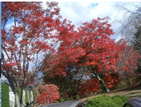
(於：富士ビューホテル以下7枚も同じ)