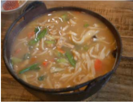
(咲花宿名物“ホウトウ”於：竹馬)

今年は殊の外紅葉が遅い。矢も盾も堪らずに富士五湖の紅葉の名所、もみじ祭り真最中の河口湖に出かけた。中央高速トンネルを抜ける毎に少しずつ山容が色づいてはいたが、今だしの感があったが、河口湖に到着。正に盛をまもなく過ぎんとする絶妙のタイミングであった。その一端を皆さんにお裾分けしたい。尚、初見であったが、富士ビューホテルは紅葉を随所に植え込んであり、紅葉の名所随一である。