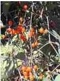
(二ノ丸庭園にてヒヨドリジョウゴの赤い実)