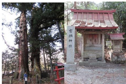
樹齢 1500 年の杉の大木と源有綱を祀る神社